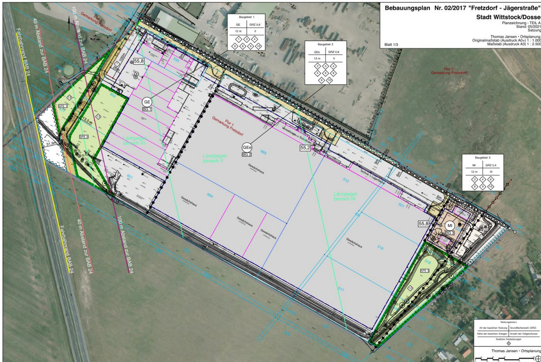
Abbildung 2: Bebauungsplan Nr. 02/2017 "Fretzdorf - Jägerstraße"